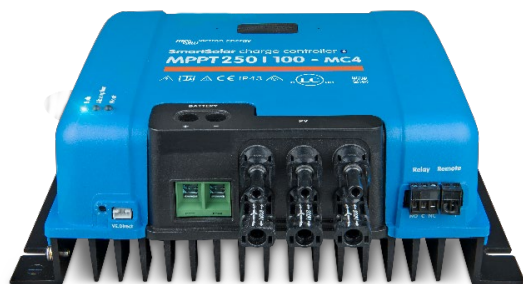
Controlador de carga SmartSolar MPPT 250/100-MC4 Sin pantalla