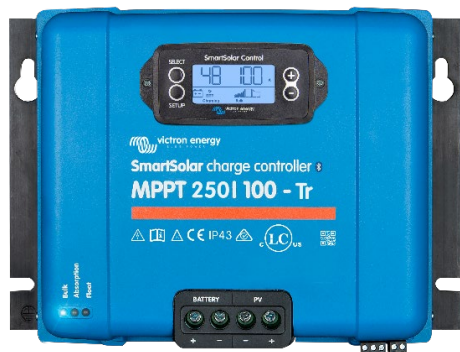
Controlador de carga SmartSolar MPPT 250/100-Tr Con pantalla conectable opcional.