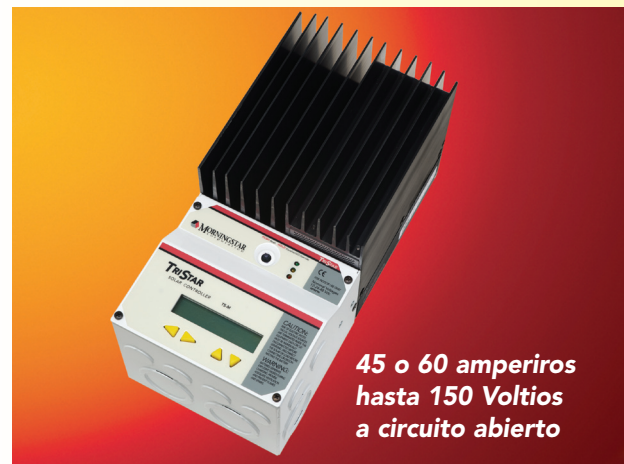
Producto mostrado con instrumento opcional.

El controlador de paneles solares TriStar MPPT de Morningstar, con tecnología TrakStar Technology™, es un avanzado controlador de carga de baterías con capacidad de detección del punto de máxima potencia (MPPT) para paneles fotovoltaicos independientes de la red eléctrica, de hasta 3 KW de potencia. Este controlador tiene un incomparable rendimiento pico del 99% y mucho menos pérdidas de energía que otros controladores MPPT del mercado.